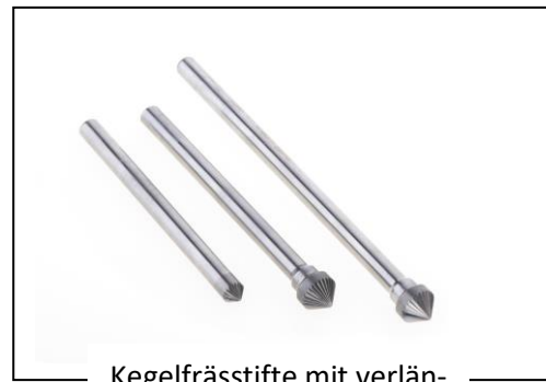
Kegelfrässtifte mit verlängertem Aufnahmeschaft