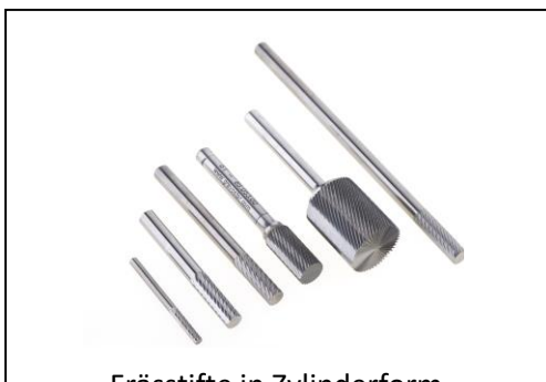
Frässtifte in Zylinderform