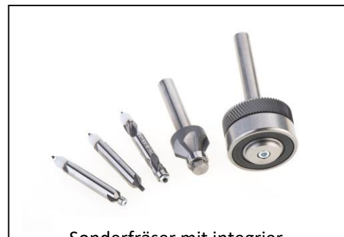
Sonderfräser mit integriertem Werkstückanschlag