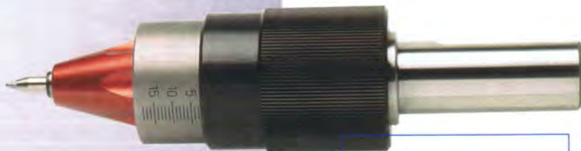
Rollprägewerkzeug Gravostar RB.

Meist sind es aktuelle Kundenanforderungen, die Maschinen- und Werkzeughersteller dazu bewegen, sich intensiv mit Weiter- oder Neuentwicklungen zu beschäftigen. Das war bei Unternehmen SEH Technik im Schweizerischen Oberuzwil nicht anders. Mit einem neuen und zum Patent angemeldeten Rollprägewerkzeug werden so künftig bei Beschriftungen die Maßstäbe in Sachen Qualität neu definiert.