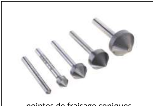
pointes de fraisage coniques

La sélection ci-dessous donne un aperçu des différentes formes et dimensions de notre offre standard.