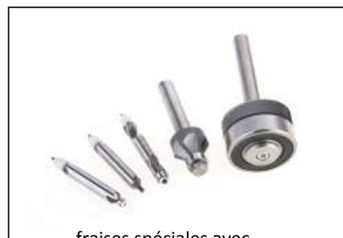
fraises spéciales avec insert de butée intégré