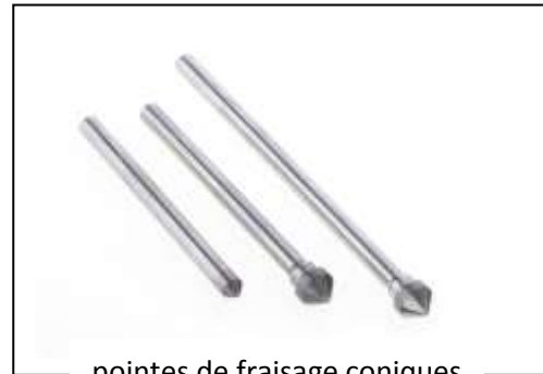
pointes de fraisage coniques avec port-outils rallongé