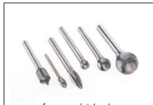
formes spéciales de pointes de fraisage