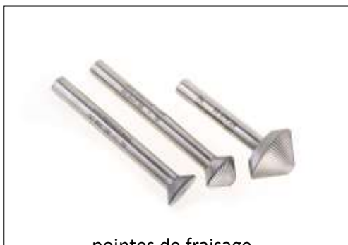
pointes de fraisage coniques spéciales